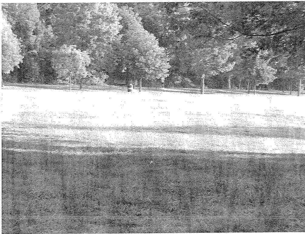
Foto n. 4 - veduta generale della porzione del parco adiacente a Villa Montalvo. Si intravedono solo cestini per l'indifferenziata.