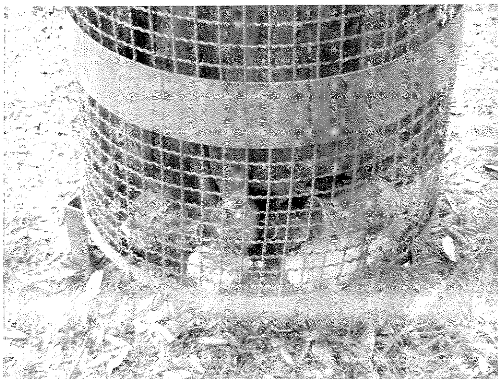
Foto n. 6 – particolare di un cestino dell'indifferenziata presente nel parco adiacente a Villa Montalvo