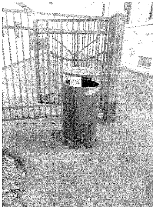
Foto 7 Ingresso Scuola Matteucci