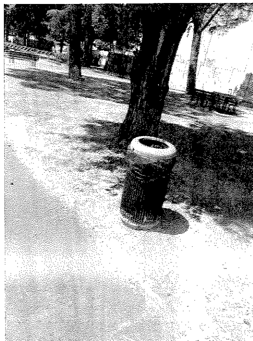
Foto nn. 2, 3 – parco Iqbal, veduta di cestini per rifiuti nella porzione di parco a confine con l'ex stadio di calcio di Via Mascagni. Anche in questo caso si tratta di cestini per l'indifferenziata.