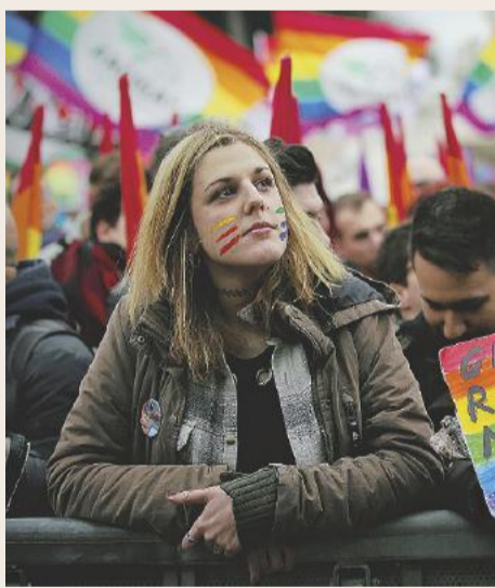
La piazza ieri a Roma la manifestazione ◦ ROTUNNO A PAG. 6

"Non ci basta", 40 mila in piazza per chiedere maggiori diritti ai gay